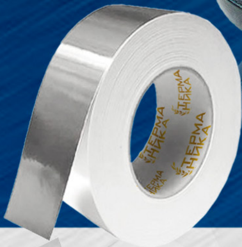
АЛЮМИНИЕВАЯ ЛЕНТА (МЕТАЛЛИЗИРОВАННЫЙ СКОТЧ)