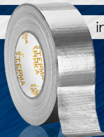
ЛЕНТА ТПЛ, ЦВЕТ СЕРЫЙ