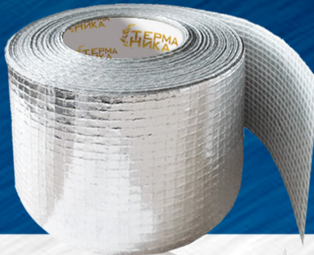
АЛЮМИНИЕВАЯ АРМИРОВАННАЯ ЛЕНТА (АРМИРОВАННАЯ В КЛЕТКУ) – УСИЛЕННАЯ