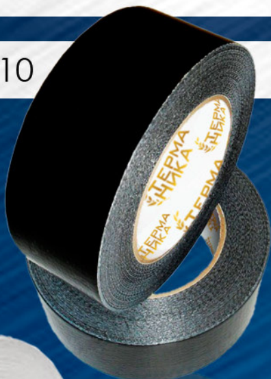
ЛЕНТА ТПЛ, ЦВЕТ ЧЕРНЫЙ